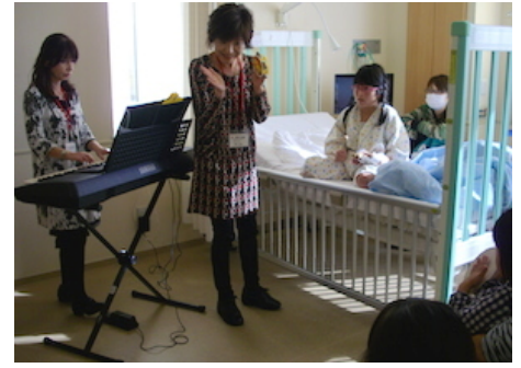
10月15日 石巻赤十字病院にて キーボードデュオ トウツティの 「音楽を楽しもう！」

今年10月より活動を開始しました。現在復興に向けて、病院増築棟、災害医療総合研修センター(仮称)を建設し、既存棟を改修中です。震災当日インフラがあったのはこの病院だけで、周辺はどこまでも暗闇。周辺の医療機関はほぼ壊滅状態で、地域20万人の命を一手に背負うことになりました。3日後にはヘリが63機、ヘリの患者だけで1251人の患者が殺到、3月下旬になっても通常の5倍もの1日300人ほどの患者が押し寄せました。被災者も殺到し、フロアを仕切り一般の人にも開放。家族の安否もわからないまま、不眠不休の極限状態で働く医療従事者ばかりだったとのこと。そんななか、入院する子どもたちの受けた精神的苦痛は計り知れませんが、打ち合わせを行なった5月時点で、震災でなくなった病院の部分、病床が減った分、地域のニーズに沿えるように、職員はいつも駆け足で働いている状況とのことでした。担当者から「是非、被災地の病院の子どもたちのところに来てください」という言葉をいただき、活動開始に至りました。