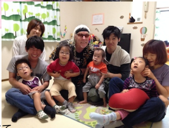
療育室つばさにて 上：11月17日 いっとくさんの「かみしばい」 下：9月30日 クラウディの「英語で遊ぼう」