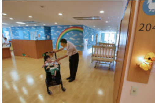
子供が不安を感じないように配慮した淀川キリスト教病院の小児ホスピス（大阪市東淀川区）

淀川キリスト教病院（大阪市淀川区）は2012年、区内に小児ホスピス「淀川キリスト教病院ホスピス・こどもホスピス病院」を開設した。これ以上治療ができないと宣告された小児がん患者が緩和ケアを受ける6床と、家族のレスパイト（休息）のための6床の計12床。約1週間を上限に利用できるレスパイト病床には現在約170人が登録、新規入院は約1ヶ月待ちの状態という。